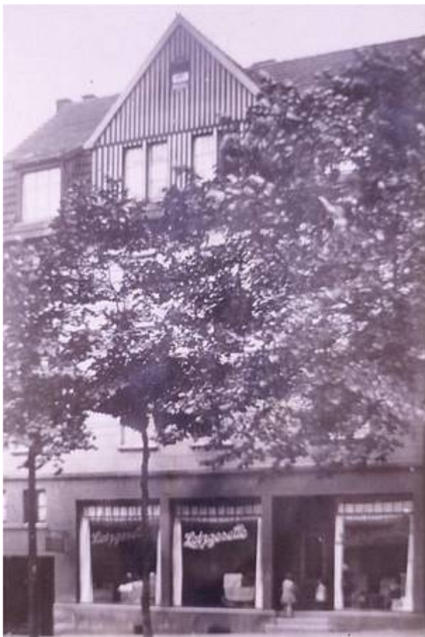
Möbelhaus, Sattlerei und Polsterei August Lotzgeselle 1 Poststraße 33 heute: Zur Werner Heide 8