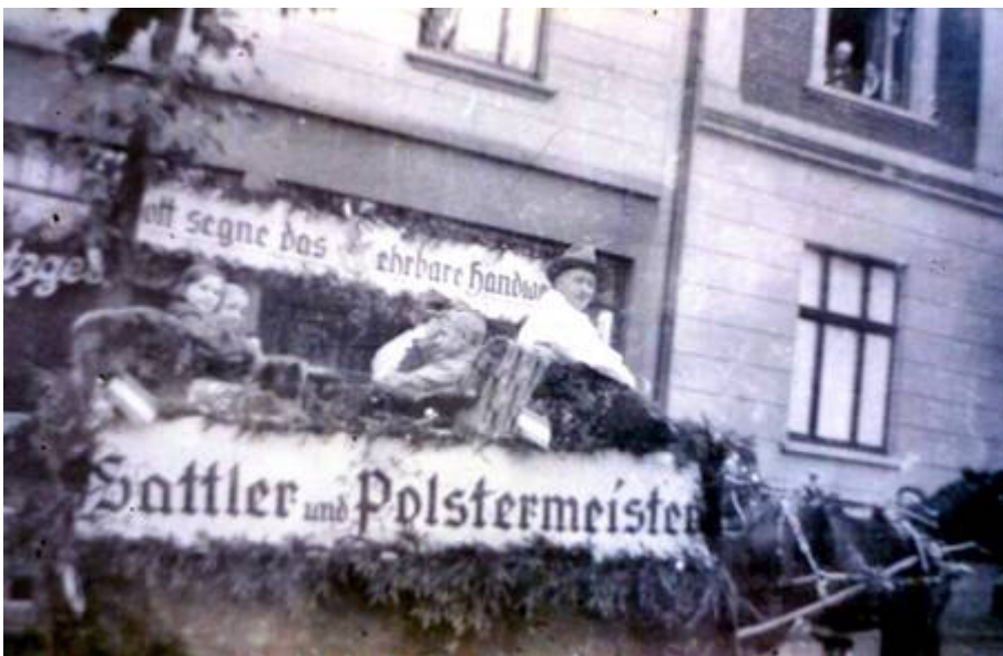
Festwagen der Firma August Lotzgeselle vor dem Haus