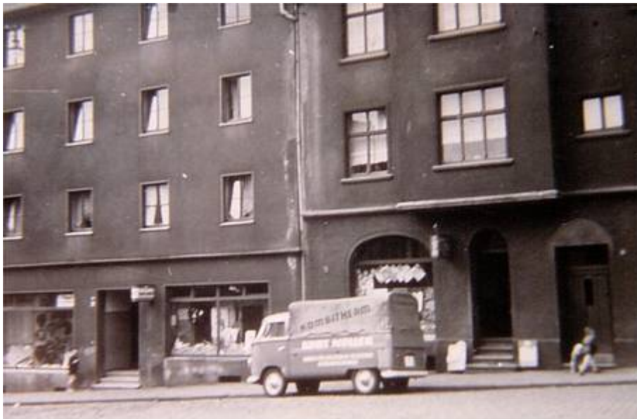
links: Frisör Otto Oberste Ufer 3 Zur Werner Heide 28