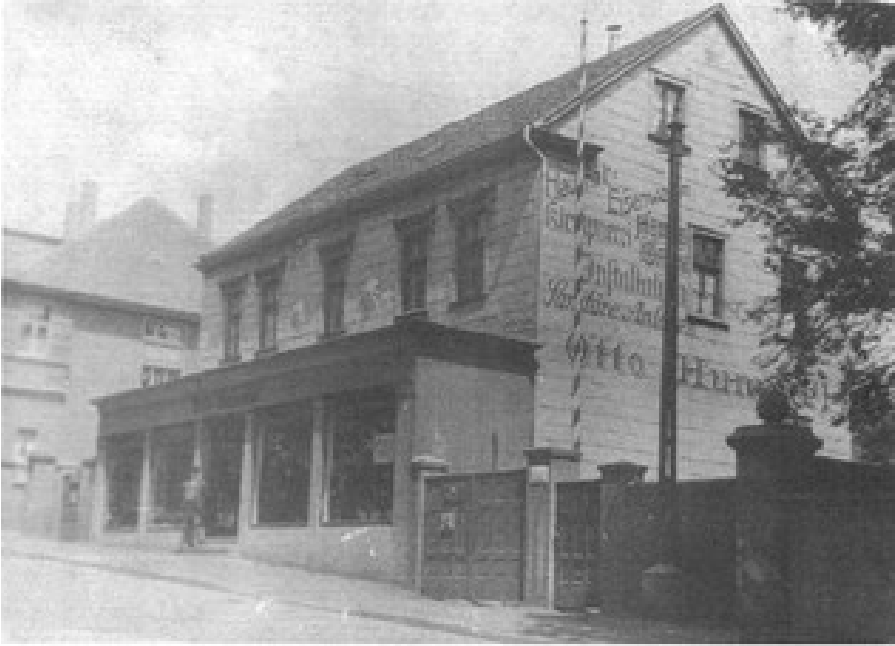
Klempnerei und Installateur Otto Hummel Poststraße 18 heute: Zur Werner Heide 9