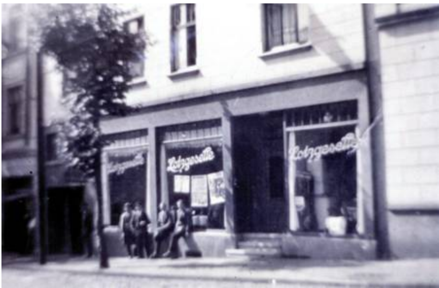
Möbelhaus, Sattlerei und Polsterei August Lotzgeselle Poststraße 33 heute: Zur Werner Heide 8