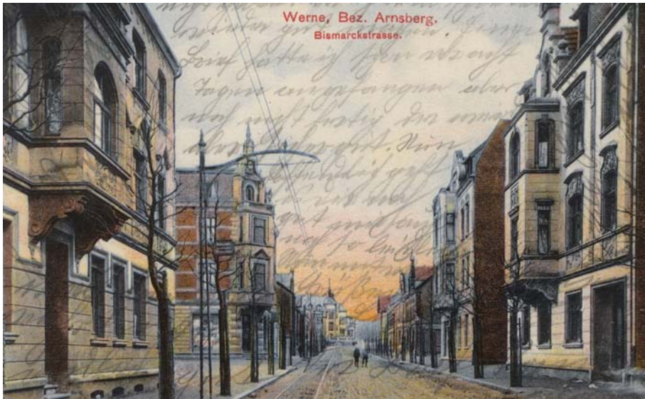
Werne, Bez. Arnsberg. Bismarckstrasse.

Hinter dem Haus vorne links zweigt die Straße Auf den Scheffeln ab. Poststempel 24.2.1912.