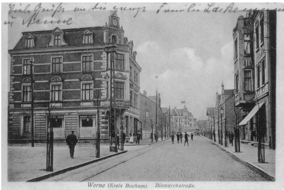
Werne (Kreis Bochum). Bismarckstraße.

Hinter dem Haus vorne links zweigt die Straße Auf den Scheffeln ab. Poststempel 24.2.1912.