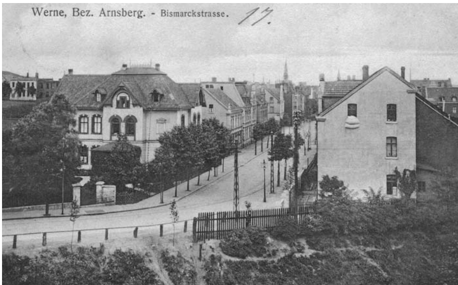
Werne, Bez. Arnsberg. - Bismarckstrasse. 17.