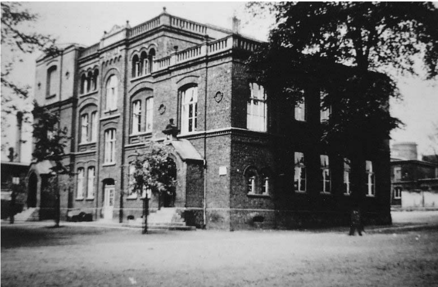
Bismarck-/Freiheitsschule auf dem Gelände der Mensa der Willy- Brandt-Gesamtschule.