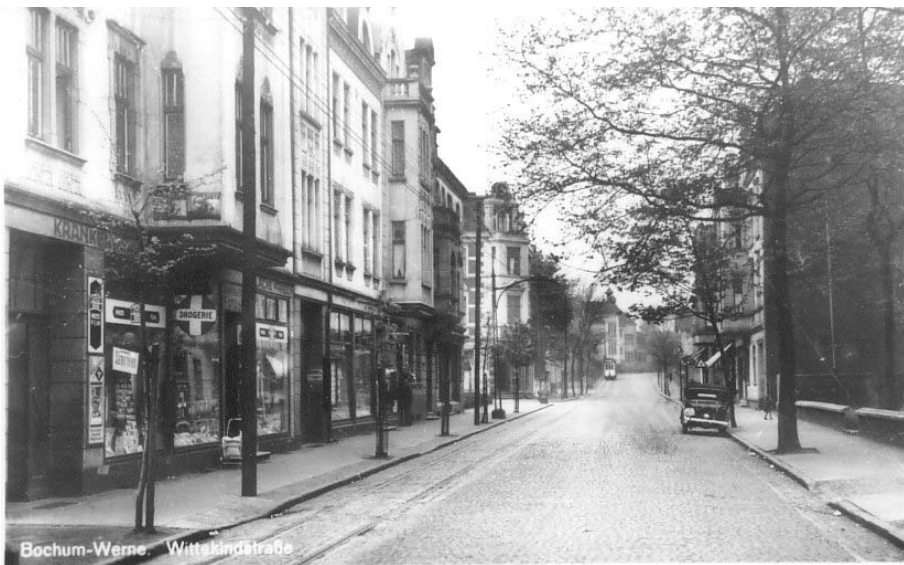
Links Haus Nr. 32, Drogerie Levenig, rechts die Mauer vom Schulgelände.