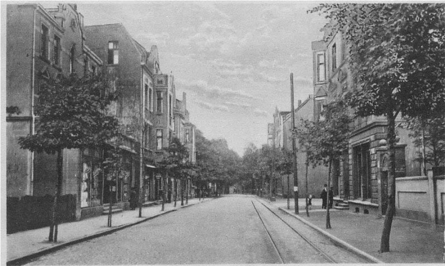
Werne (Kreis Bochum) Freiheitsstraße