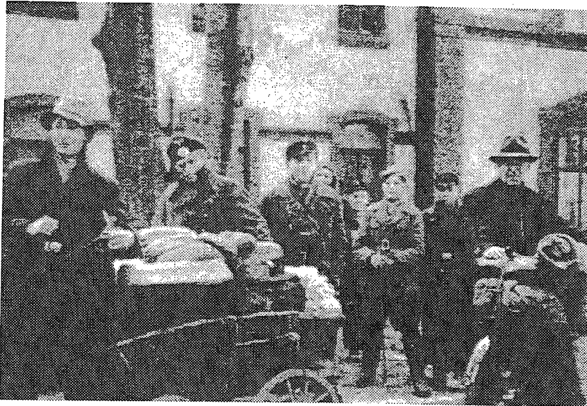
Abb. 6: Einige Schüler auf der Flucht nach Westen; Schiefer mit Fahrrad

Kohlenkahn über den Bodden gesetzt zu werden. Am Morgen stand der Russe schon in dem von Schwesow etwa 10 km südlich gelegenen Gülzow. Als wir etwa mitten auf dem Bodden waren, schlugen die ersten Granaten in Cammin ein.